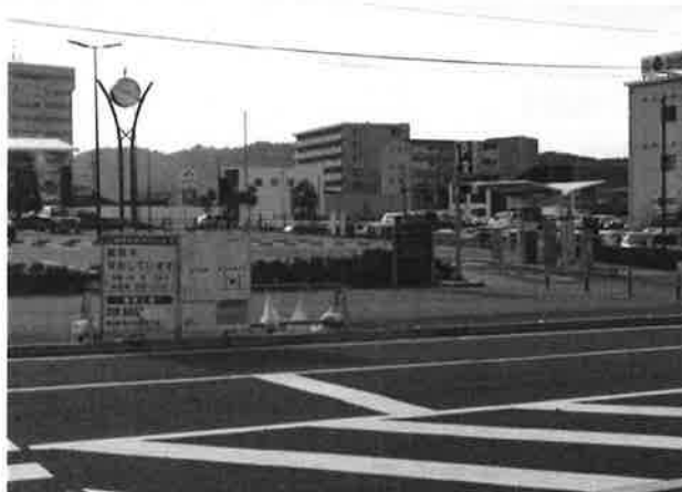
(駅前ロータリーから分離された一般駐車場)