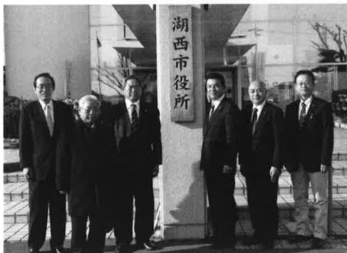
(湖西市役所正面玄関前にて)