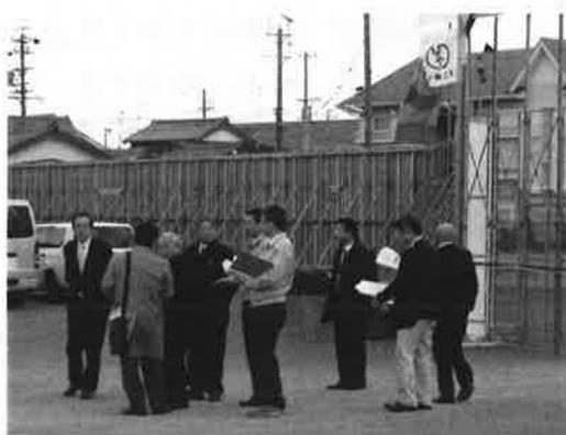
(現地での説明の様子)