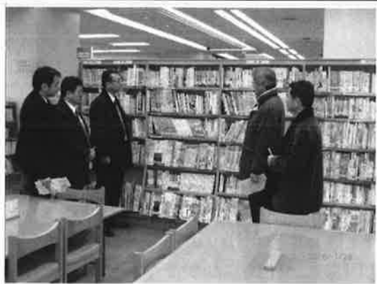
(事業別財務諸表に記載があった町田中央図書館を実際に視察)