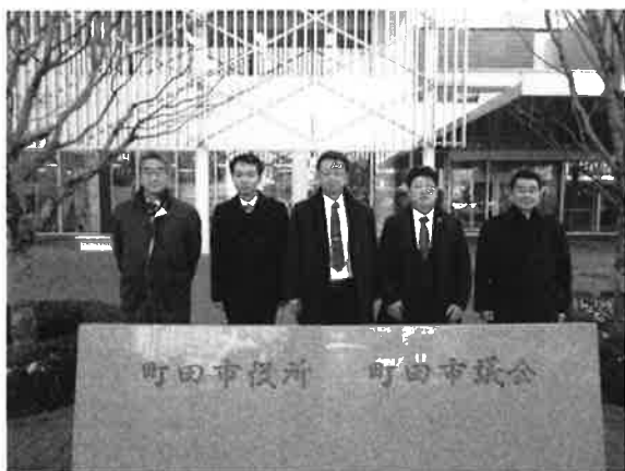
(町田市役所庁舎前)

今回の調査を通して、また過去においても行政評価システム、事業別行政評価シートの活用を図り議会活動の中では決算審査に用いるよう主要な施策の成果報告書としての活用など提案は再三行ったが思うような事業別行政評価シートの作成、主要な施策の成果報告書に至っていない。今回の調査に企画財政課長も同行し事業別行政評価シートを活用しての行政マネジメントの必要性を認識されたものと推測する。今後この調査を踏まえ委員会に於いて議論し提言に結び付けたい。