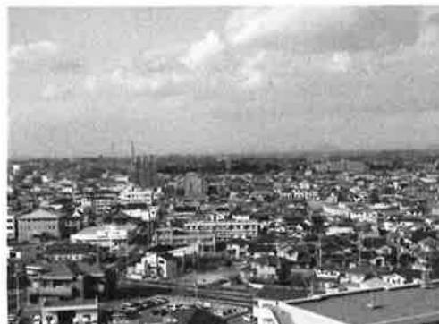
(駅前区画整理事業の状況)