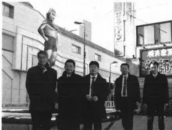
(小田急線祖師ヶ谷大蔵駅前のウルトラマン像)