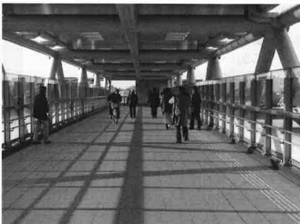
(自転車も通行可能な南北自由通路)