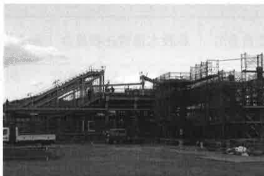
(現在工事中の駅舎～南口から～)