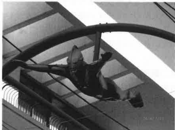
(視察帰路における東京都世田谷区の祖師谷商店街の街並み見学) ウルトラマンによる町おこし