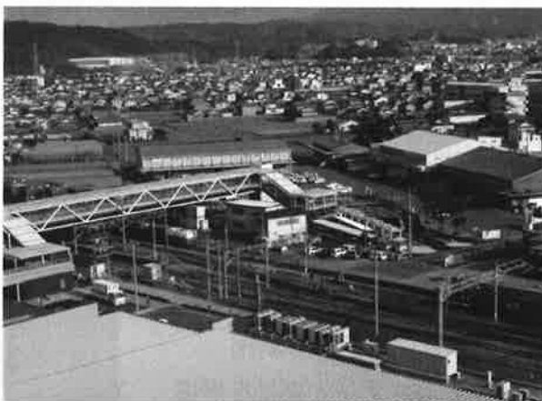
(南北自由通路と南口広場)