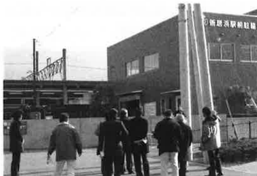
(新居浜駅前駐輪場)