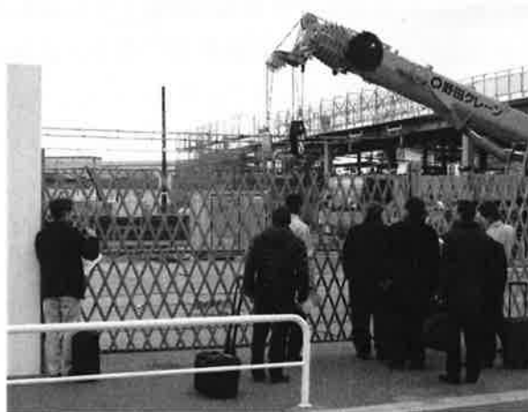
(新所原駅北口周辺の整備状況視察研修)

A：新所原駅には高速バスは乗り入れていないが、当該駅からそれぞれ15分程度でアクセスできる豊橋駅及び浜松駅からは出ている状況である。