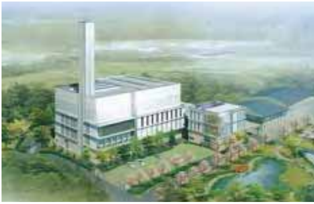
業者提案・当初イメージ図

平成28年2月17日に2月定例会が開催され「監査委員の選任につき同意を求めることについて」、「須賀川地方新ごみ処理施設建設運営事業に関する契約締結について」、「平成27年度須賀川地方保健環境組合一般会計補正予算(第2号)」、「平成28年