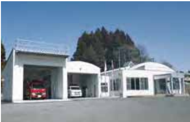
石川消防署玉川分署

本組合は、須賀川市、石川町、鏡石町、天栄村、玉川村、平田村、浅川町、古殿町の1市4町3村で構成されています。須賀川市に本部を置き、2消防署、6分署、1分遣所で組織され、消防ポンプ自動車8台、タンク車5台、特殊車両4台、救急自動車12台を配置し、213人(平成28年度)の職員で、地域の安全・安心を築くため昼夜を問わず活動しています。