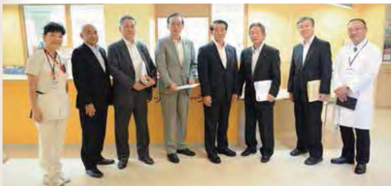
地域包括ケア病棟の視察(9月30日) 企業長、院長、副院長兼看護部長より説明を受けました。

平成28年9月30日に9月議会定例会が開催され「平成27年度公立岩瀬病院企業団病院事業会計決算の認定について」「平成