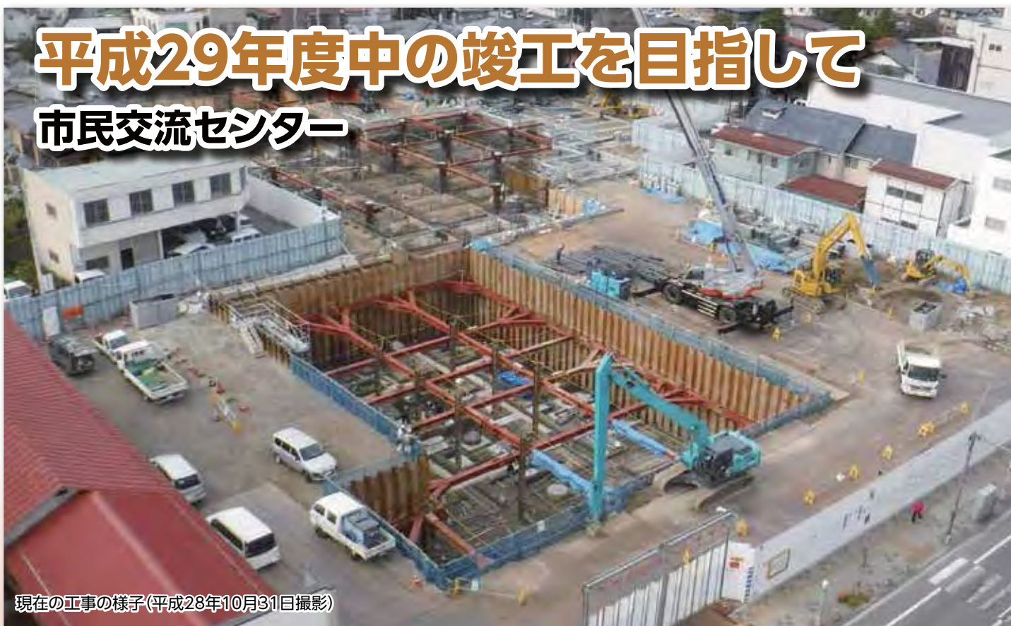
現在の工事の様子(平成28年10月31日撮影)