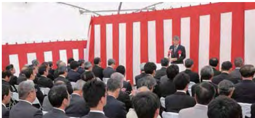
新ごみ処理施設建設安全祈願祭

また、11月8日にごみ処理施設建設に関わる組合議会議員による先進地視察が行われ、宮城県亘理名取共立衛生処理組合・岩沼東部環境センターを視察しました。