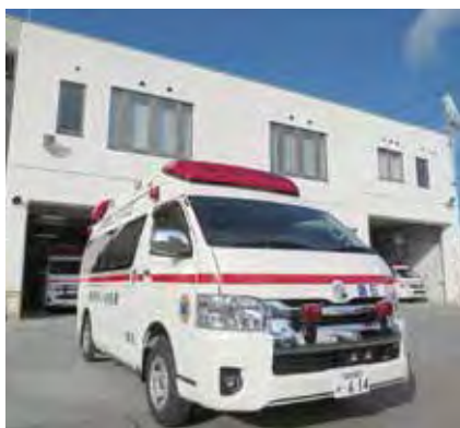
高規格救急自動車(須賀川消防署鏡石分署に配置されました。平成28年10月)

第8回消防ふれあいデー(9月17日) 昭和48年からの統計では、平成26年の火災発生件数50件が過去最少でした。今年、それをさらに下回るよう、子どもからお年寄りまで防災意識を高めるための広報活動にも力を入れています。