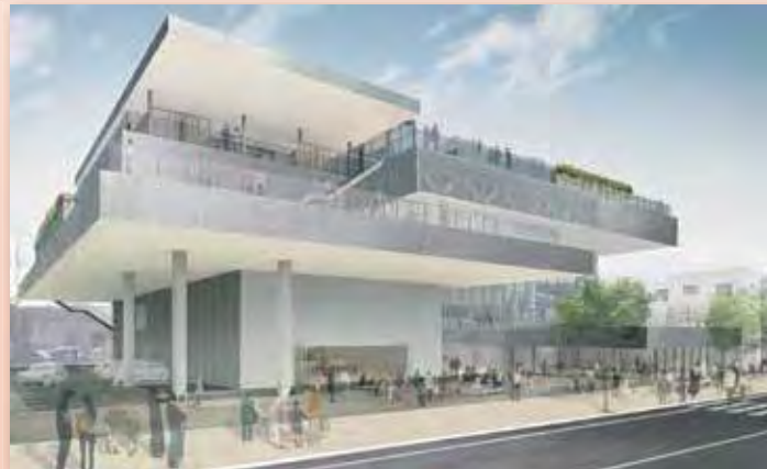
市民交流センター完成予想図

市民交流センターは、杭工事が完了し、現在、基礎工事を進めているところです。年内には鉄骨工事に着手し、年明けからは仮囲いの外からも交流センターの姿が徐々に見えはじめてきます。