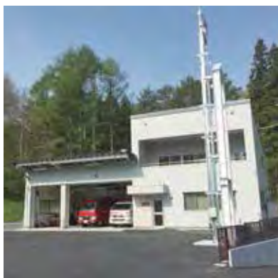
須賀川消防署長沼分署湯本分遣所新庁舎(平成28年4月竣工)

10月21日に議会定例会が開催され「平成28年度須賀川地方広域消防組合一般会計補正予算(第1号)」「平成27年度須賀川地方広域消防組合一般会計歳入歳出決算の認定について」など6件について審議し、全会一致で可決されました。